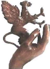
Gryf Powiatu Dębickiego 2010